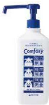
カンファシイスプレー